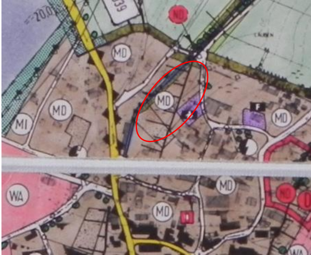
Abb. 1 Ausschnitt wirksamer Flächennutzungsplan rote Linie: Änderungsbereich B-Plan