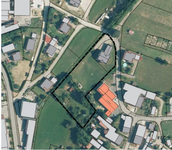
Abb. 3 Luftbild mit Parzellenkarte: © Bayerische Vermessungsverwaltung 2025 (ohne Maßstab)

Die Fl.-Nr. 106 die nun vorrangig bebaut werden soll, wird aktuell als Garten genutzt. Benachbart liegende Fl.-Nr. 112 wird grünlandartig gepflegt. Auf Fl.-Nr. 112/1 steht bereits ein größeres Wohnhaus mit Doppelgarage.