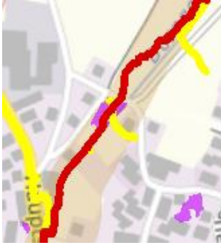
Abb. 4 Auszug aus dem Umweltatlas Bayern (braun: wassersensibler Bereich, gelb und rot: potentielle Fließwege bei Starkregen, violett: Geländesenken und potentielle Aufstaubereiche)

Im UmweltAtlas Bayern (HIOS-Karten – nachfolgend abgebildet) ist im Grabenbereich entsprechend der Verlauf eines potentiellen Fließweges bei Starkregen eingezeichnet. Darüber hinaus ist aber auch aufgrund der Hanglage mit aus östlicher Himmelsrichtung oberflächlich und wild ablaufendem Hangwasser zu rechnen.